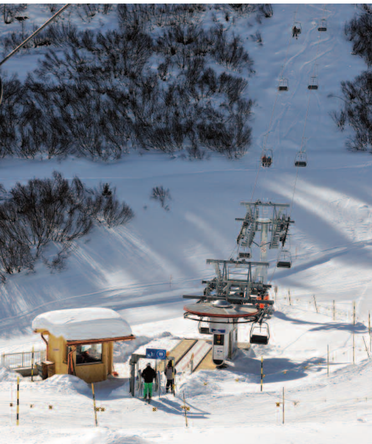
Sesselbahn Allmiboden – Allmendhubel, Baujahr 2009

folgten auch alle Installationen für den Bau. Kleine Mengen Beton wurden vor Ort hergestellt, grössere mit Fahrmischern angeliefert. Nötige Helitransporte erfolgten ab Winteregg, respektive unterhalb Mittelberg.