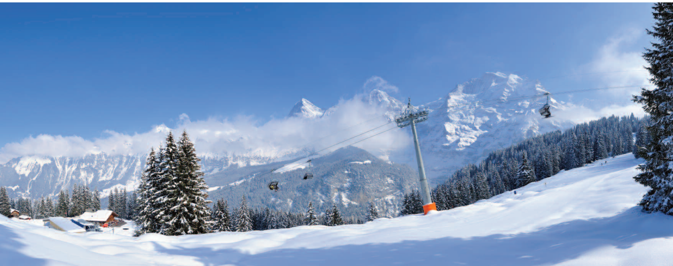
Die neue Sesselbahn Winteregg – Maulerhubel