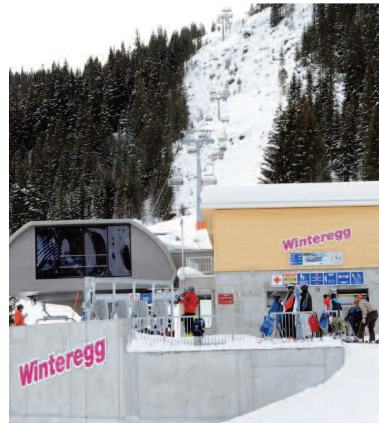
Kuppelbare Vierersesselbahn Winteregg – Maulerhubel, Baujahr 2009

Als Installationsplatz dienten verschiedene Flächen der Bergschaft Winteregg. Alle Materialtransporte erfolgten auf dem Güterweg und der Forststrasse Isenfluh – Winteregg. In der Winteregg er-