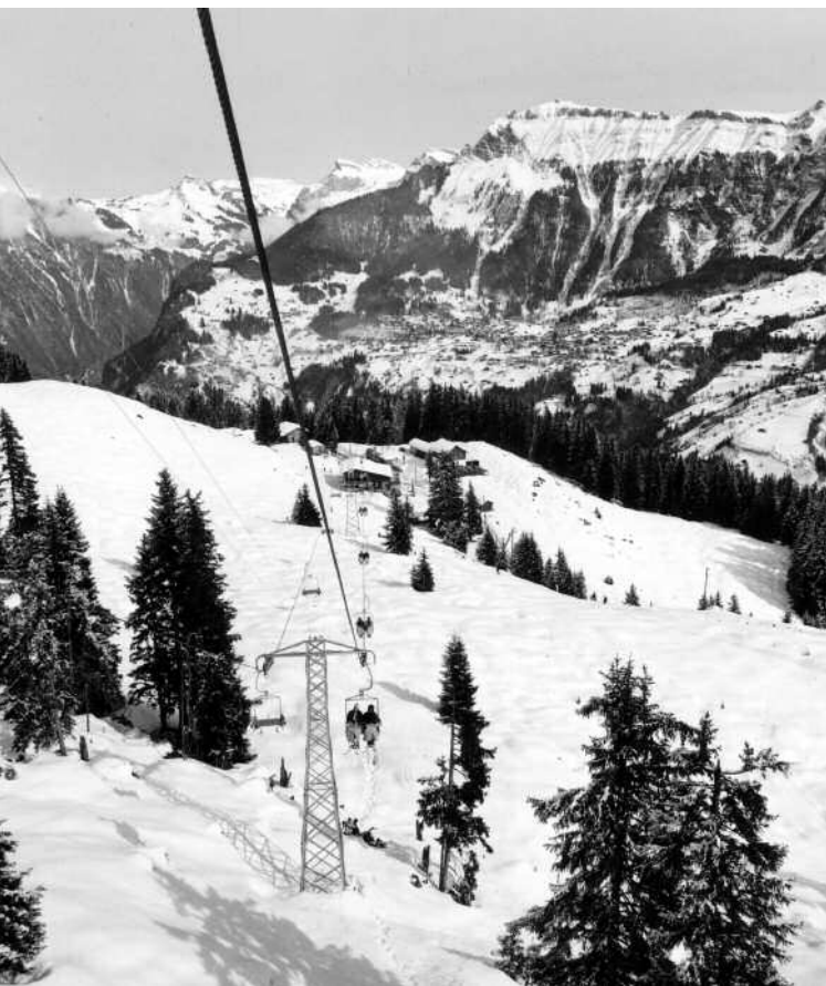
Sesselbahn Winteregg – Maulerhubel, Baujahr 1971

Das Echo aus den Kreisen unserer Wintergäste ist ausgesprochen positiv: